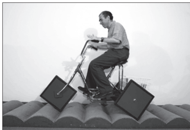
Рис. 7. Велосипед с квадратными колесами

Цепь, вернее, цепная линия может быть связана с велосипедом самым неожиданным образом. На рисунке 7 показан трехколесный велосипед с... квадратными колесами. Условием того, что такой велосипед будет