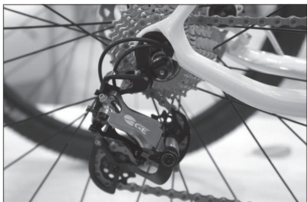
Рис. 6. Фото механизма переключения скоростей современного велосипеда

Но главное упрощение в анимации, кадры которой показаны на рисунке 5, в том, что не показаны две дополнительные звездочки, выполняющие две функции. Во-первых, они натягивают цепь и, во-вторых, перекидывают цепь со звездочки на звездочку при переключении передач (рис. 6).